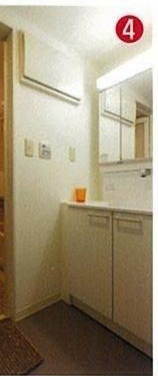
A/既存の床は傷だらけでした。 B/既存の洗面台。 C/既存の和室。壁はタバコのせいで黄ばんでいました。