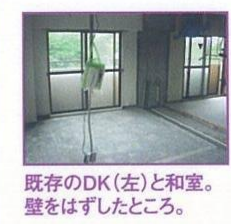
既存のDK(左)と和室。壁をはずしたところ。